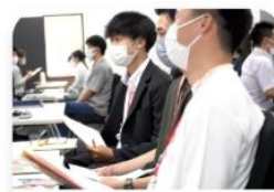
14:10 - 16:00 座談会/個別面談タイム