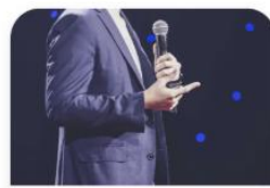
12:40 - 14:00 企業/就活生交流タイム