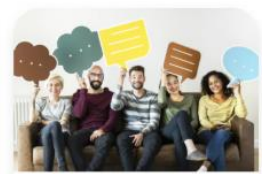
16:00 - キャリアアドバイザー